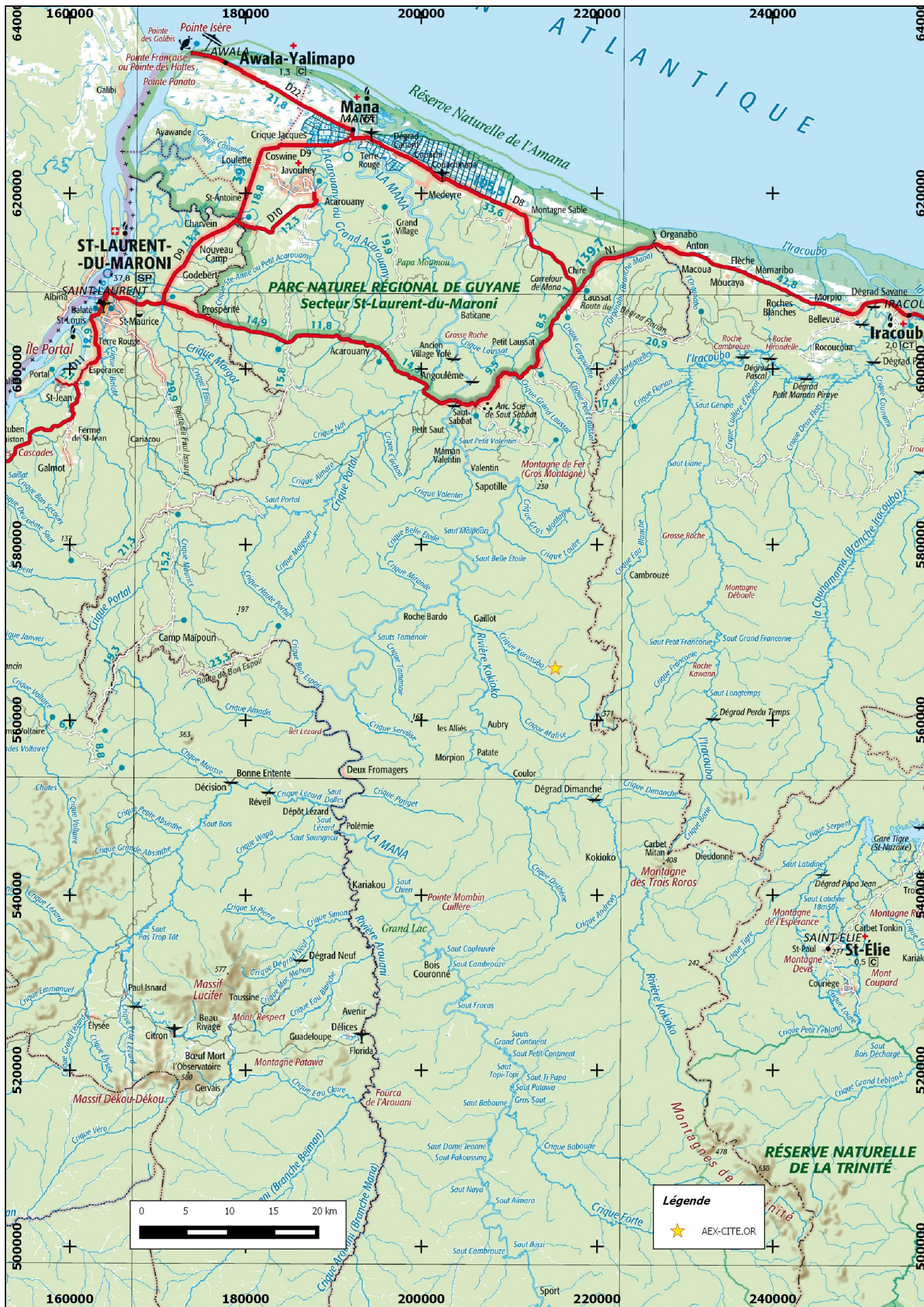
Carte de situation de l'AEX « crrique Flora aval » de la SARL CITE'OR sur la commune de Mana sur un fond de carte IGN au 1/500 000° en RGF95 UTM22